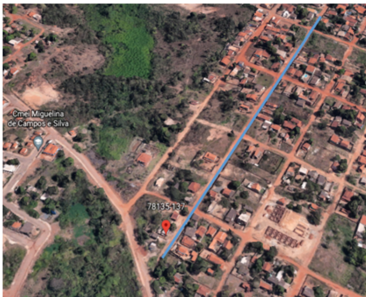
Figura 03- Rua Coronel João Bueno, Bairro Jardim Paula II.

declínio nas médias nos períodos letivos presenciais onde ocorreu a permanência de longo período de tempo dentro do transporte público coletivo.