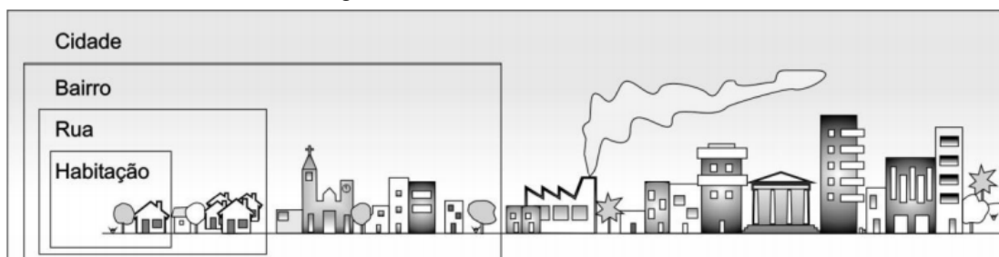
Figura 01- Diferentes escalas urbanas.

apresenta a escala urbana que será adotada para a compreensão da influência que o bairro possui no desempenho escolar dos estudantes.