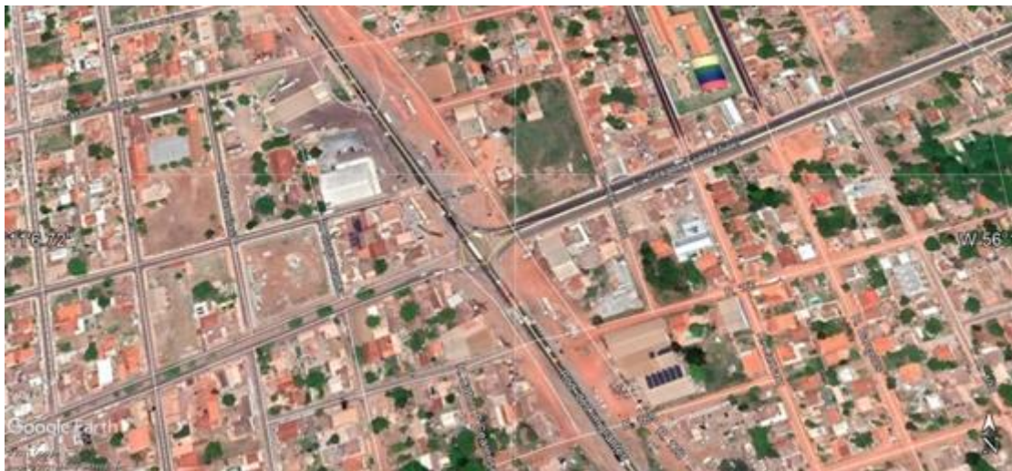
Figura 3 - Cruzamento da Avenida Senador Filinto Muller com a Rodovia dos Imigrantes